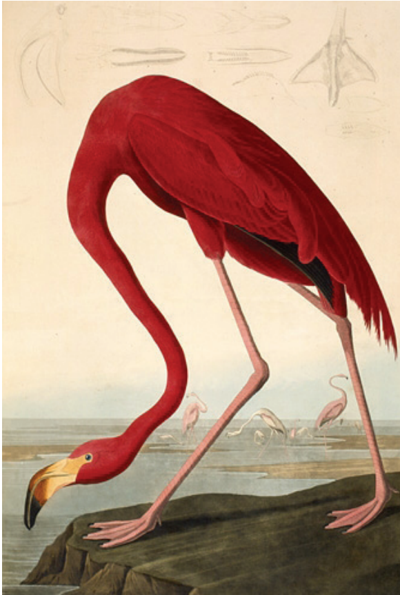
Rys. 5. J. Audubon, rycina z Birds of America przedstawiająca flaminga

Tekstowy świat Teofrasta, na ile możemy go dziś widzieć w zachowanych ułamkach, był pierwszą szeroko zakrojoną próbą zastosowania metod tekstualizacji doświadczenia wypracowywanych w greckiej kulturze intelektualnej przez całe IV stulecie w odniesieniu do całego zakresu zjawisk świata przyrody i kultury. W następnych stuleciach, w dużej mierze dzięki dokonaniom tego autora, nastąpił bujny rozwój greckojęzycznej Fachliteratur .