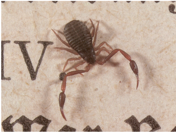
Rys. 1. Zaleszczotek na piśmie

w orbicie „myślenia tekstem”, w którym ogół ludzkich procesów poznawczych jest pojmowany jako rodzaj ZAPISYWANIA umysłu treściami uchwytywanymi i kategoryzowanymi w postrzeżeniach, jak gdyby umysłowo-cielсны zestaw ludzkiej świadomości refleksyjnej był skrzyżowaniem maszyny do pisania z katalogiem bibliotecznym i z obu tych narzędzi miało korzystać ludzkie „ja”, konstruuując obraz zewnętrżności. Albo też, by użyć nowszej metafory technologicznej, miałby to być mały komputer zainstalowany w głowie każdego noworodka wraz z systemem operacyjnym i ładowany wyspecjalizowanym oprogramowaniem w trakcie pierwszych dwudziestu lat życia. Poszukując rozwiązania zagadki, jaką stanowimy sami dla siebie, często chwytamy się własnych wytworów, lecz one nie udzielają nam odpowiedzi innych niż te, które w nich umieściliśmy.