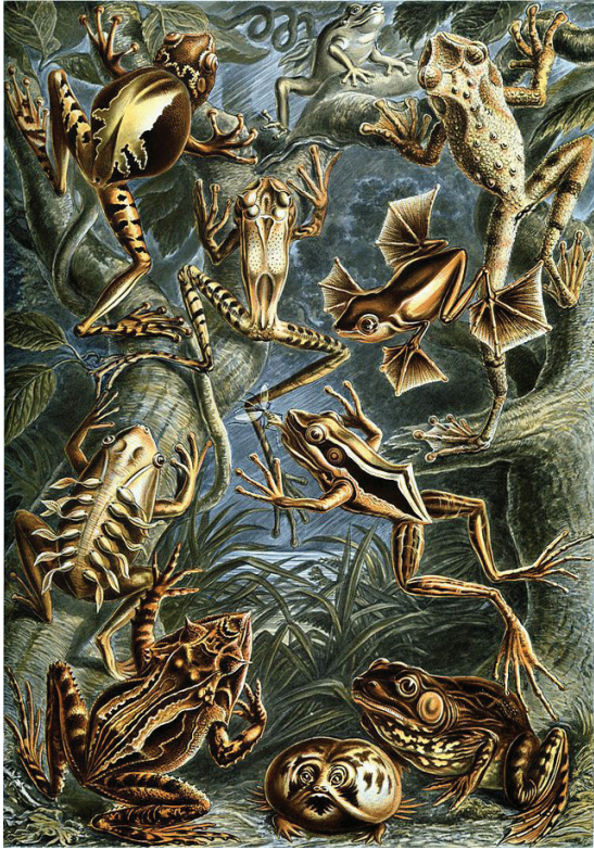
Rys. 3. E. Haeckel, rycina z Kunstformen der Natur przedstawiająca żaby